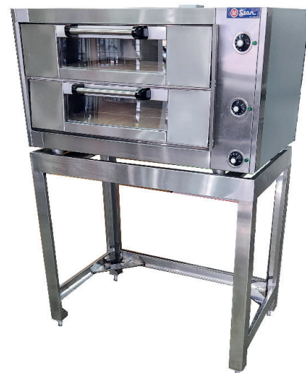
OPCIONAL TME76-8 BASE PARA HORNO 102cm